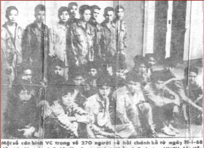
Một số cán bình VC trong tố 270 người về hồi chánh kẽ từ ngày 31-1-68 đền 12 giờ ngày 2-2-68. Họ được Chánh Phủ và Quân Lực VNCH đốn tiếp và đãi ngộ lịch sự. An ninh của họ cũng được bảo đảm.

Hiện giớ còn một vài phần từ sống sới ần trồn trong những nơi đóng dân cư. Xin đồng bào bảy mạnh dạn tố cáo hoặc bắt bọn chúng đem giao nạp cho cơ quan công quyền. Chính phủ và Quản tực VNCH hôn trôn bảo vộ tanh mạng và tài sin của đồng bào. Vậy đồng bào cử yến tâm và tin trởng vào Quân Lực của ta có thừa sức đập tan bắt cử ăm mưu hôn hạ nào của chúng.